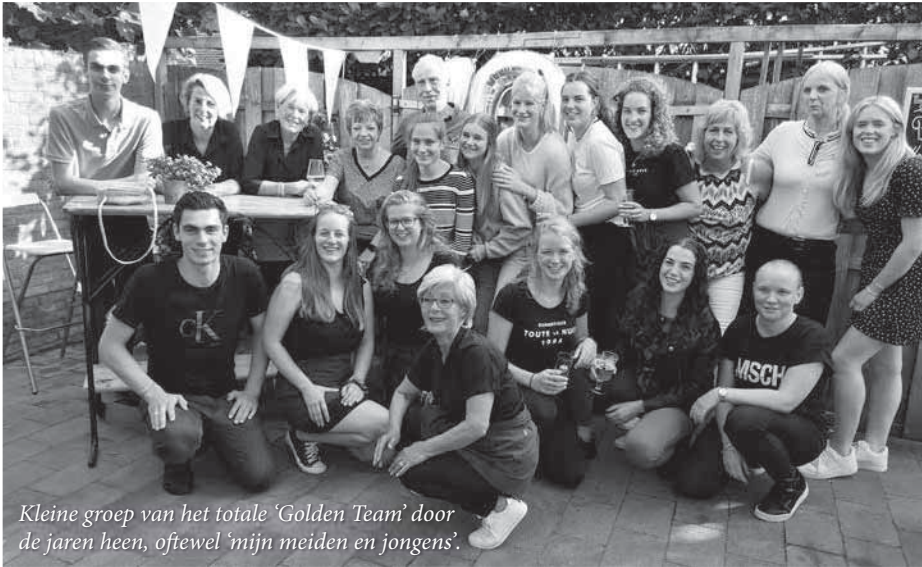
Kleine groep van het totale 'Golden Team' door de jaren heen, oftewel 'mijn meiden en jongens'.