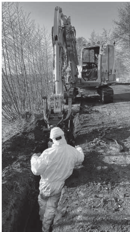
De asbest cement waterleiding wordt uit de berm verwijderd ten behoeve van een nieuwe kunststof waterleiding.

Dus kwam er een plan, nou ja eigenlijk meer een verkenning, hoe gaan we het aanpakken. Dit gebeurde in overleg met de bewoners en het buurtcomité Stichtse Meije. In augustus 2012, ja toen al. Meer info op www.veiligemeije.nl . De weg moest worden verhoogd en verbreed. In het 'Achterend' wel 90 cm verhoging. Afijn, dat eerste plan duurde tot eind 2015. Maar men kwam er niet uit. Wat was het geval? Het versterken van de kade wordt betaald door de HDSR. De weg op de kade door de gemeente Woerden. Daar had Woerden niet op