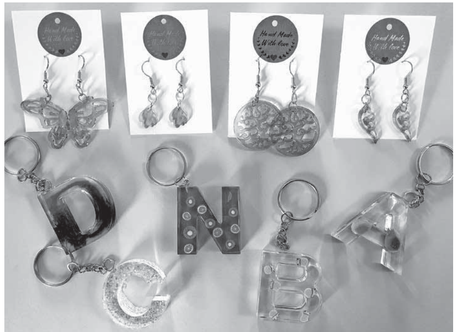
Op de foto de door Ise zelfgemaakte sieraden.

"Ik wil iedereen graag bedanken die me heeft